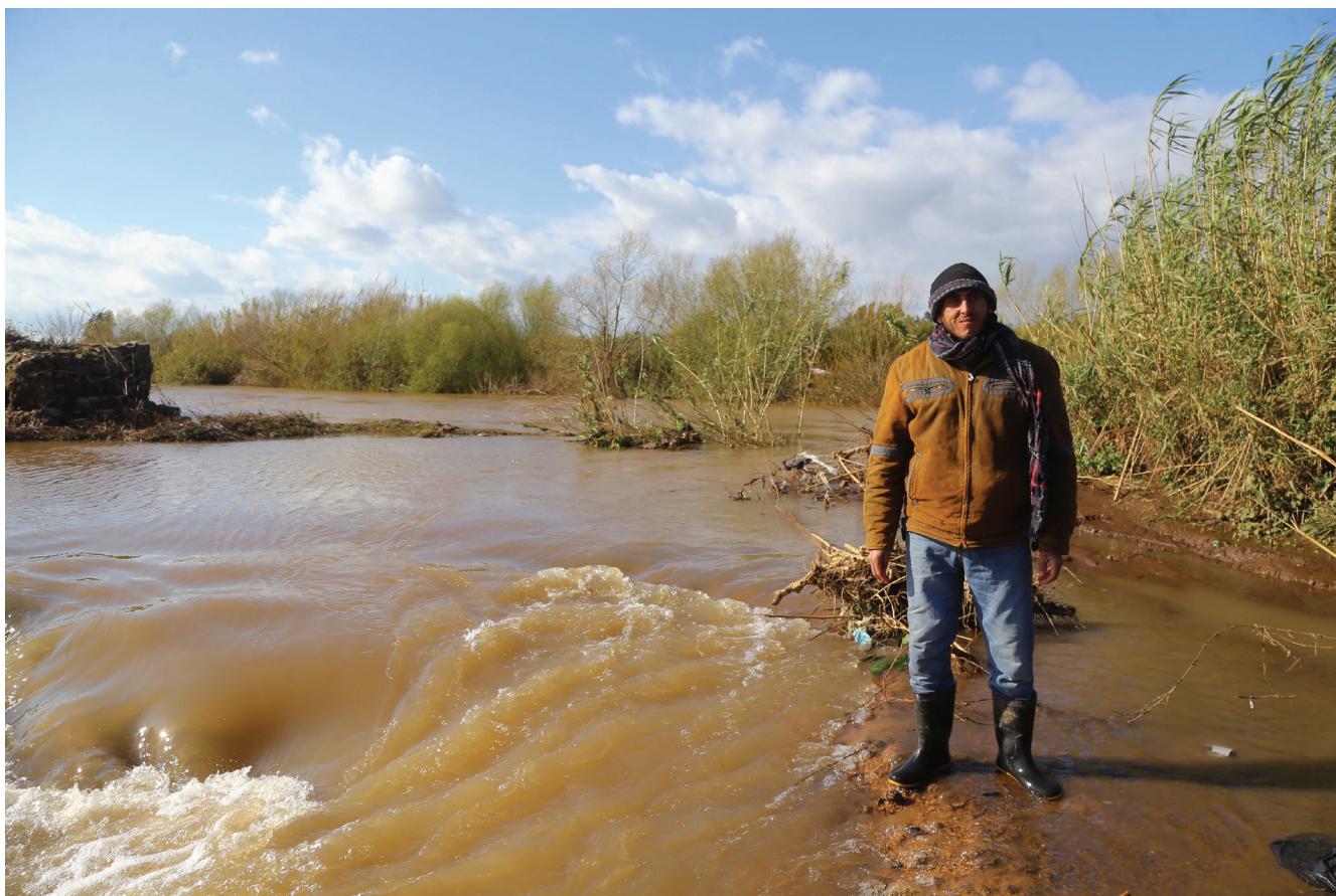
Un réfugié syrien à la frontière de Nahr El kebir en 2019.

de la fonction publique dès l'époque de Camille Chamoun (1952-1958). Selon l'avis d'un de ses résidents 7 , cela aurait contribué à réduire la tendance à faire du trafic.