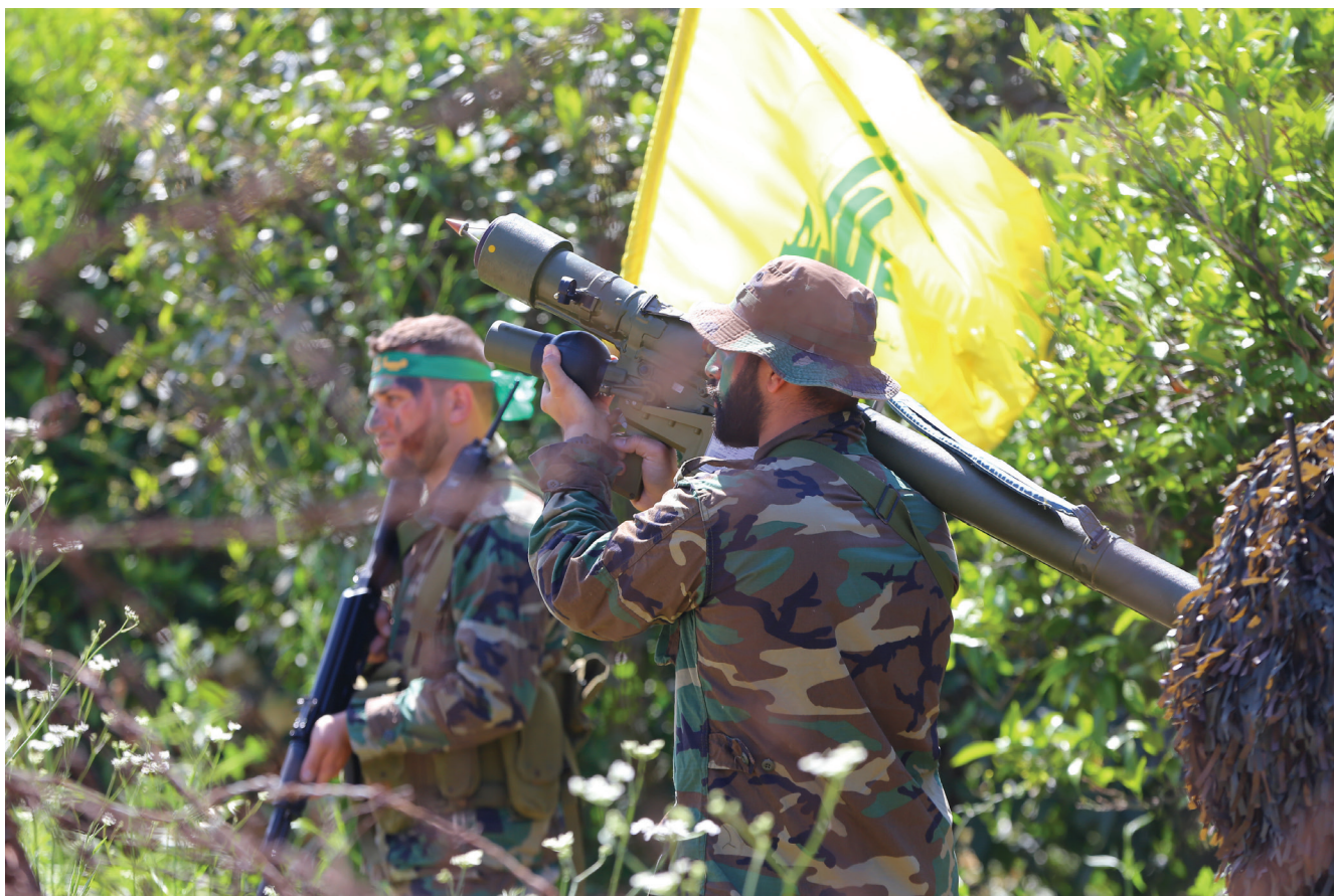
Miliciens du Hezbollah en manœuvre (© 2017 Hussein Baydoun).

utilisées antérieurement pour la contrebande à l'époque de la tutelle syrienne (Obeid, 2010). Au cours de l'été 2014, le 2 août, près du village de Eرسال ou se trouvait un grand rassemblement de réfugiés syriens, dans un environnement favorable aux insurgés, apparut soudainement un groupe de 700 jihadistes affiliés à la branche locale d'al-Qaïda, le Front al-Nusra (devenu plus tard Hayat Tahrir al-Cham), accompagnés de miliciens de l'État islamique arrivant du Qalamoun. Ils déferlèrent sur la région en dévastant les positions de l'armée libanaise, faisant une vingtaine de victimes dans les rangs de la troupe et prenant un nombre élevé d'otages y compris dans les rangs de la police 24 . Les négociations aboutirent le 7 août au retrait des jihadistes dans le jurd de Eرسال après avoir libéré trois otages. Détenant encore 39 otages, ils