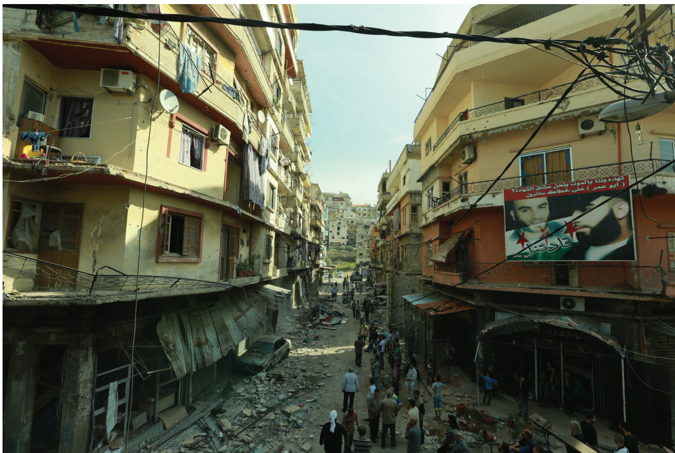
La rue de Syrie entre les quartiers de Bab Tebbaneh et Baal Mohsen en 2014.

rupture avec celle de l'armée syrienne du Président Assad : celui-ci entendait éviter tout changement politique révolutionnaire au Liban en luttant contre les troupes d'Arafat. En outre, dès leur arrivée, les troupes syriennes jouèrent sur l'appartenance confessionnelle, celle des alaouites, créant un rapprochement politique à base confessionnelle entre le régime syrien et les résidents de la colline de Baal Mohsen. Cette dernière fut rapidement mise sous la tutelle d'un homme lige du régime syrien, Ali Eid, et sa formation politique, le Parti Démocratique Arabe (PDA), qui prit appui sur l'ancien mouvement de la Jeunesse alaouite.