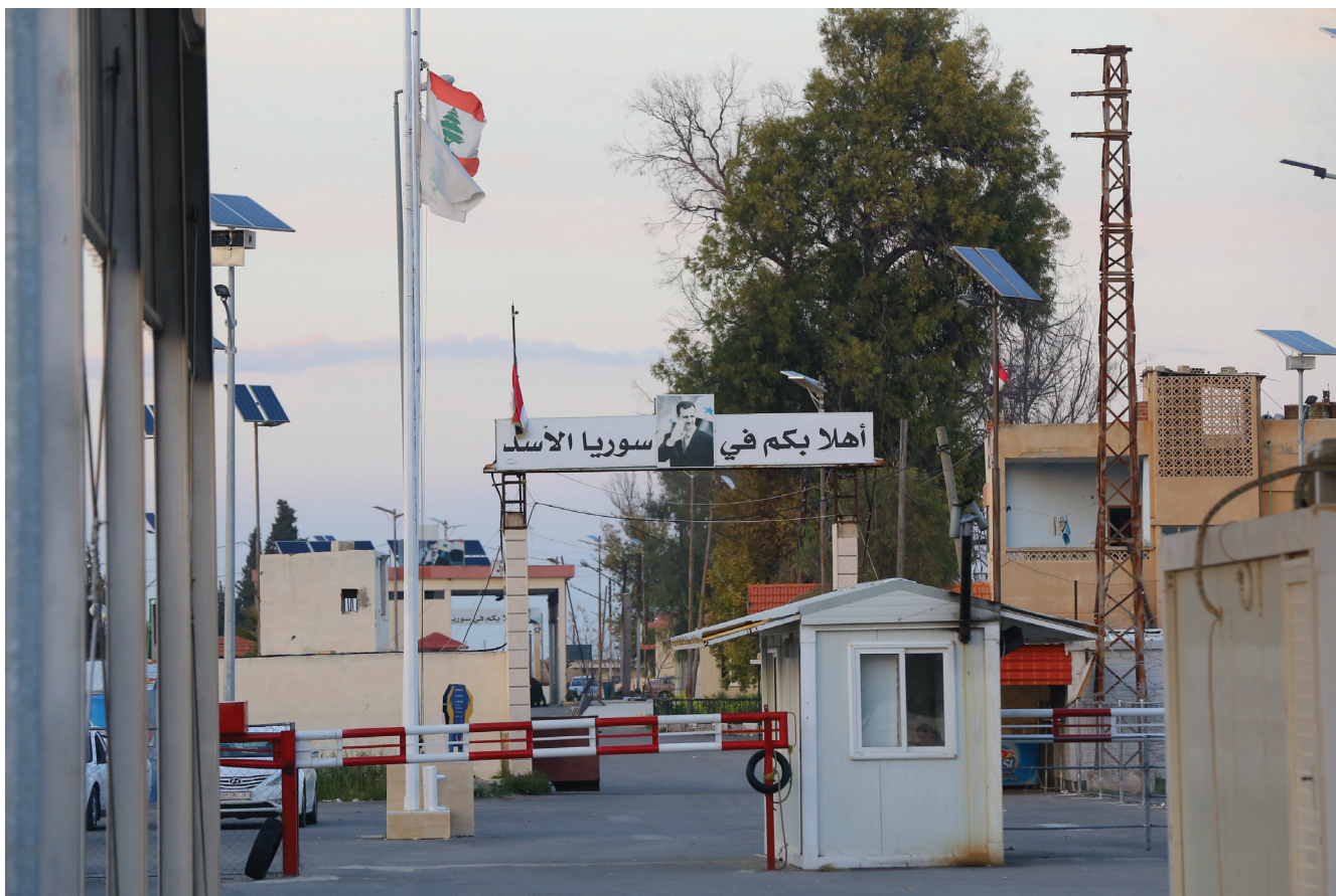
Le poste frontière d'al-Qaa en 2019.

libanaise issus de villages du Akkar pour rejoindre les rangs du Front al-Nusra, la branche d'al-Qaida au Liban 11 . Durant l'été de la même année, plusieurs étrangers furent arrêtés pour appartenance au groupe État islamique : arrivant de pays européens, ils préparaient ou avaient pris part à l'organisation de plusieurs attentats suicides qui avaient frappé des postes de l'armée ou la banlieue sud de Beyrouth. Le Liban était entré sur la carte des cibles du jihad global et plus seulement de ses émanations locales en lien avec le conflit syrien. Le modus operandi de l'attentat suicide s'est alors reporté sur le quartier symbole de la communauté alaouite à Tripoli, Baal Mohsen, qui, en raison de son association avec le régime syrien, fit les frais