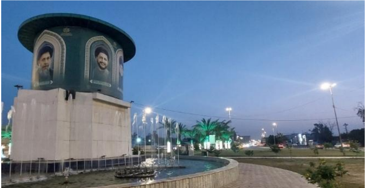
La place des Sadr, Najaf, Irak. Portraits de Muhammad Baqir al-Sadr, Musa al-Sadr et Muhammad Sadiq al-Sadr (assassiné par le régime irakien en février 1999).

pas dans ce mystère que réside la force du personnage et les raisons pour lesquelles son héritage continue à être réactivé, voire sacralisé, par une multitude d'acteurs.