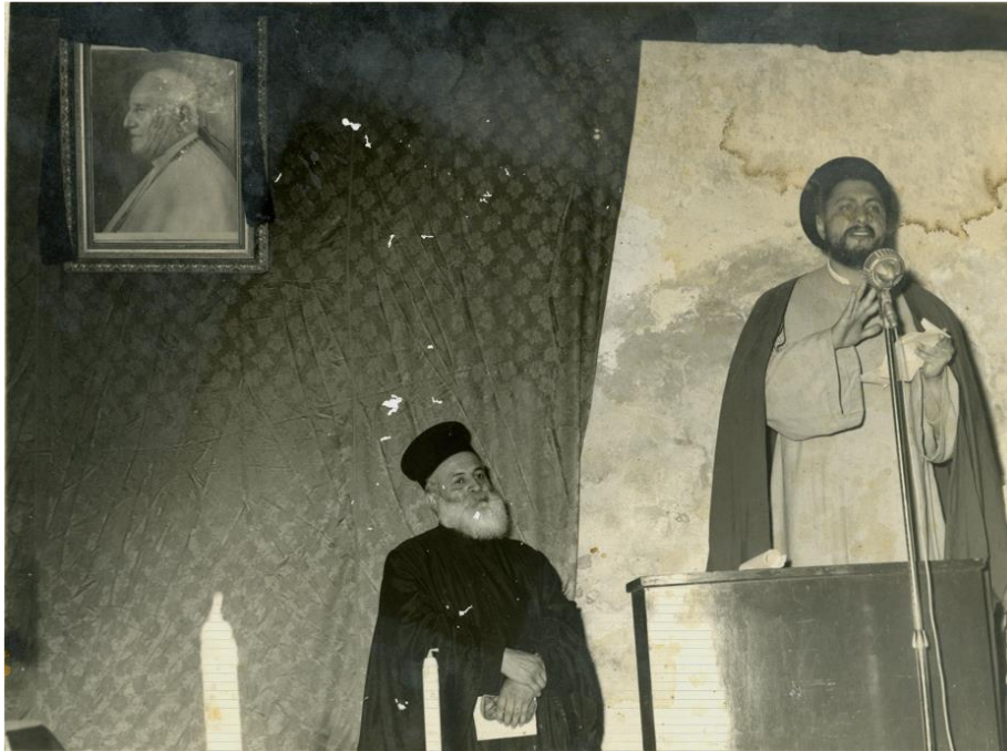
Musa al-Sadr prononce un discours à Tyr dans le cadre d'une cérémonie organisée en l'honneur du pape Jean XXIII.

nourrissant de ses pairs afin de développer un discours, de dessiner un horizon de dignité, de sécurité et de prospérité.