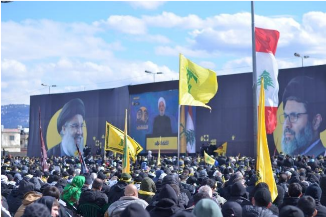
Naïm Qassim, l'actuel secrétaire général du Hezbollah, prononce un discours retransmis à l'intérieur et à l'extérieur de la ville sportive de Beyrouth le 23 février 2025

des avions militaires israéliens qui survolèrent la ville sportive, provoquant un torrent de slogans, de déclarations d'allégeance et de poings levés, entre inquiétude et exaltation.