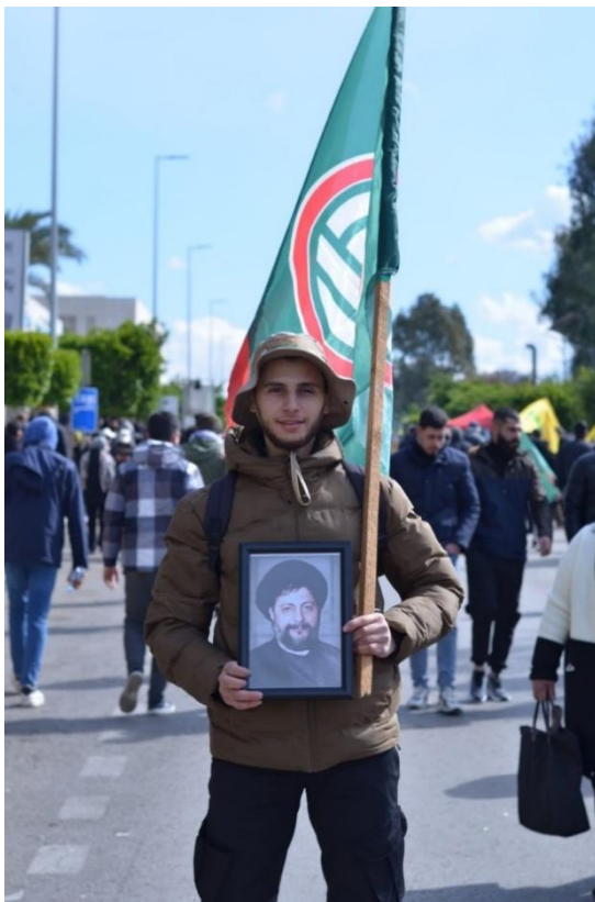
Un militant d'Amal porte un drapeau et un portrait de Sadr le 23 février 2025.

Les cérémonies funèbres organisées le 23 février 2025 à Beyrouth par le Hezbollah pour commémorer la mort de son historique secrétaire général Hassan Nasrallah, témoignaient, elles aussi, de la permanence de Musa al-Sadr dans le paysage politico-religieux libanais. Comme le laissait entrevoir le portrait fièrement porté par ce jeune militant libanais du mouvement Amal le jour des funérailles de Hassan Nasrallah, Musa al-Sadr continuait à surplomber de son regard tranquille le destin du Liban et de la communauté chiite malgré un demi-siècle d'absence. « L'Imam », comme on l'appelait depuis la fin des années 1960, a été le moteur d'un réveil dynamique et kaléidoscopique des « déshérités sur leur terre », les chiites libanais historiquement marginalisés par l'État dont se revendique aujourd'hui pleinement le « duo chiite » incarné par le mouvement Amal et le Hezbollah. Cette filiation fut en effet posée dès les premières minutes dans le discours du nouveau secrétaire général du Hezbollah Naïm Qassim, ancien responsable culturel du mouvement Amal de 1975 à 1982.