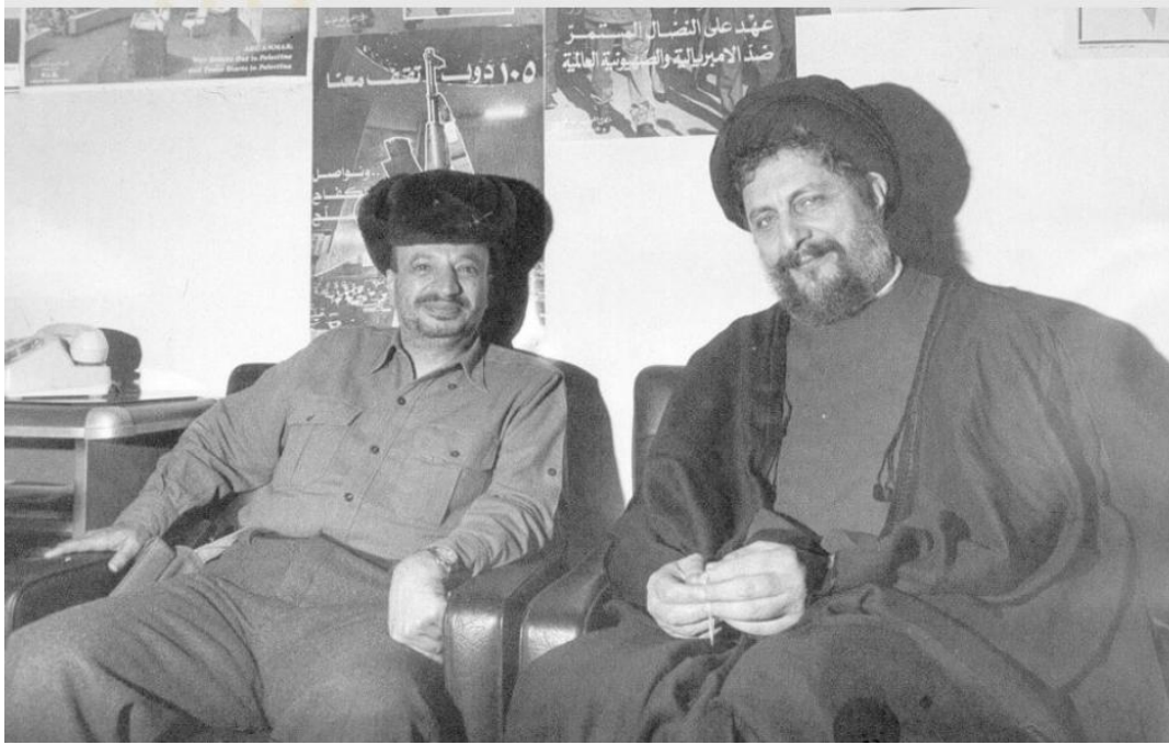
Musa al-Sadr et Yasser Arafat dans un bureau de l'OLP au milieu des années 1970