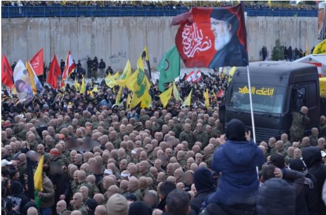
Des membres du Hezbollah assurent la sécurité pendant le passage du cortège funèbre abritant les dépouilles de Nasrallah et Safi al-Din. On peut apercevoir un drapeau d'Amal (vert) au milieu des drapeaux jaunes du Hezbollah

Dans son discours du 31 août dernier, le président d'Amal commença par saluer les « martyrs tombés dans la dernière agression israélienne sur le Liban, à la tête desquels le frère et le compagnon de route, Sa Sainteté le sayyid Hassan Nasrallah », qu'il connaît depuis 1976, puis les « habitants des villages frontaliers du Liban-Sud dont les maisons ont été détruites et les champs incendiés » par l'armée israélienne depuis le 8 octobre 2023.