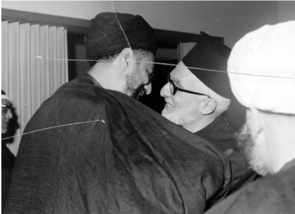
Musa al-Sadr et Grégoire Haddad à la fin des années 1960

comité juridique en raison de ses études à l'Université à Téhéran » 13 . Des villageois chrétiens du Sud emmenés par Grégoire Haddad invitaient aussi leurs voisins chiites pour rompre le jeûne pendant le ramadan, tandis que Sadr invitait les chrétiens à venir célébrer l'assomption, par exemple dans le village frontalier de Shaqra le 15 août 1964.