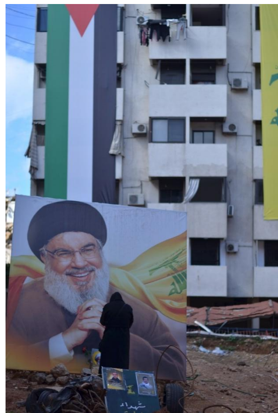
Une femme se recueille sur le lieu où Hassan Nasrallah fut assassiné à Beyrouth, 20 février 2025

Son discours d'hommage, suivi par quelques centaines de milliers de personnes réunies dans la capitale libanaise et retransmis en direct, fut néanmoins entrecoupé par les moteurs