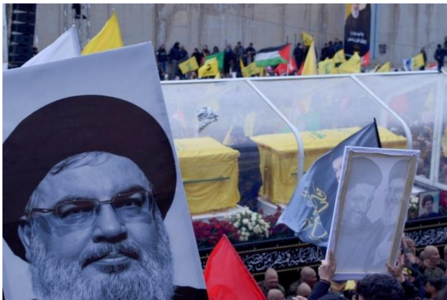
Un participant porte un montage affichant Sadr et Nasrallah face à face pendant le passage des dépouilles de Hassan Nasrallah et Hashim al-Safi al-Din, 23 février 2025

Le portrait de Musa al-Sadr, souvent agrémenté par montage de celui de Hassan Nasrallah, rayonnant et tout sourire, accompagnait ainsi les dépouilles des deux leaders vers leurs mausolées, faisant ses adieux, par sourires interposés, à celui qui avait été un des anciens fidèles.