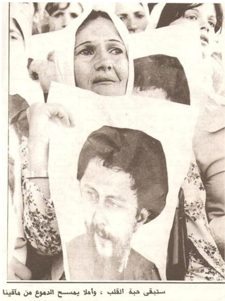
Une femme porte le portrait de Sadr dans ses mains pendant un rassemblement dans le Liban Sud. « Tu resteras le sanctuaire de nos cœurs et un espoir qui sèche les larmes aux coins de nos yeux »

sayyid Musa, chef religieux, politique et militaire d'une immense partie de la communauté chiite, il se voulait un pont entre les belligérants. Son projet était de mettre fin à la guerre civile et d'unifier l'ensemble des composantes de la société libanaise contre Israël. Bafouant les normes d'hospitalité arabe dont Kadhafi se faisait le champion, ce dernier fit disparaître son invité pendant sa visite, exécutant les basses œuvres d'un complot vraisemblablement ourdi dans plusieurs capitales régionales. Invité officiellement pour les cérémonies de la « révolution d'al-Fatih » instaurées par le colonel pour célébrer sa prise de pouvoir le 1 er septembre 1969, Sadr venait d'être emprisonné ou assassiné par les services de sécurité du pays hôte, à l'époque dirigés par Abd Allah al-Senoussi.