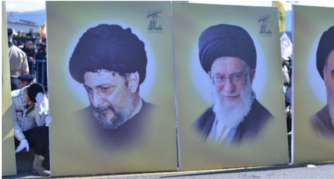
Portraits de Musa al-Sadr, l'ayatollah Khamenei et l'ayatollah Khomeini exposés par les scouts du Mahdi (rattachés au Hezbollah) le jour des funérailles de Hassan Nasrallah, 23 février 2025

nationale, dans un pays, qui est le nôtre à tous, et comme il le répétait : « si son Sud est affligé, c'est l'ensemble du Liban qui en est affecté » 25 .