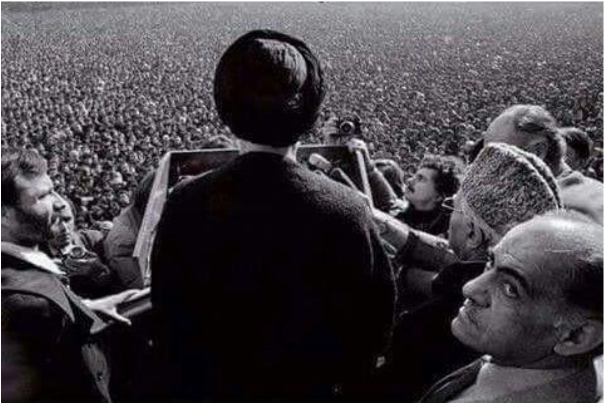
Musa al-Sadr prononce un discours à Baalbek le 17 mars 1974 pour le lancement du mouvement des déshérités.