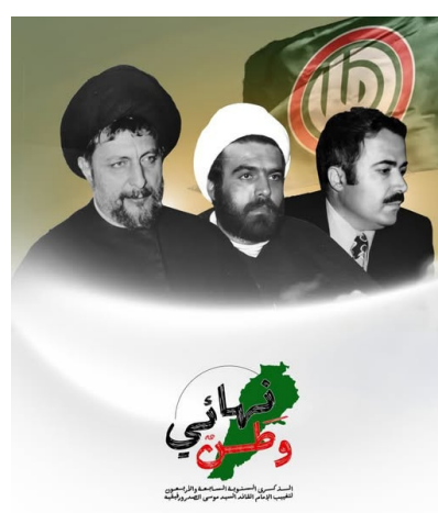
Affiche publiée le 31 août 2025 par le mouvement Amal sur laquelle on peut apercevoir l'Imam et ses deux associés ainsi qu'une carte du Liban sur laquelle est écrit « Patrie définitive », renvoyant au slogan de Sadr, « Le Liban est la patrie définitive de l'ensemble de ses fils ».

Les successeurs de Sadr sont ainsi systématiquement désignés « député du président du CICS », afin de souligner la place, pas tout à fait vacante, qui est toujours attribuée à l'Imam malgré son absence. Le 31 août 2025, après des frappes israéliennes meurtrières sur le Liban Sud, le cheikh 'Ali al-Khatib réactivait l'héritage de l'« Imam de la Nation et de la Résistance » :