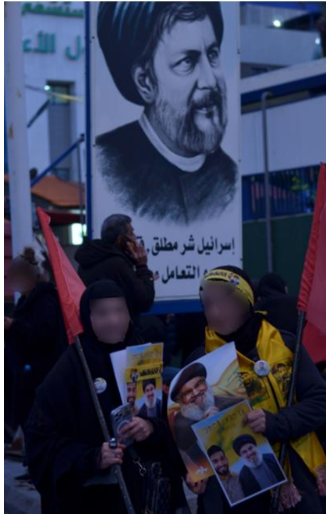
Deux jeunes femmes portent des portraits de Nasrallah et de martyrs devant l'hôpital al-Rasul al-Azam, sur la route de l'aéroport de Beyrouth le 23 février. Derrière elles, on peut apercevoir un portrait de Musa al-Sadr et deux de ses célèbres phrases « Israël est un mal absolu » et « La collaboration avec Israël est illicite », 23 février 2025

L'armée israélienne entamait un retrait vers la « bande frontalière » quelques mois plus tard, conservant de février 1985 à mai 2000 le contrôle d'une « zone tampon » qui représentait environ 10 % du territoire libanais avec l'aide de milices supplétives. Le 16 février 1985, commémorant l'assassinat du cheikh Raghîb Harb un an plus tôt, le Hezbollah annonçait officiellement son existence dans une lettre ouverte adressée « aux opprimés de la terre ». Le parti s'imposa à partir de ce moment-là et dans les deux décennies suivantes comme l'acteur politico-militaire le plus important du champ de la « Résistance libanaise », historiquement plurielle, jouant un rôle majeur dans le retrait sans condition de l'armée israélienne du Liban Sud en mai 2000.