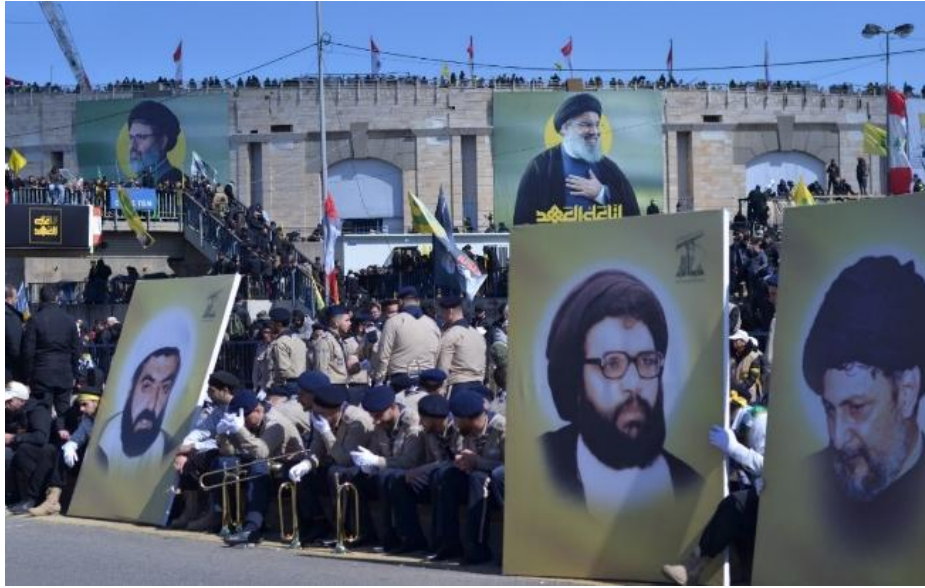
Premier plan : portraits de Raghیب Harb, Abbas al-Musawi et Musa al-Sadr affichés par les scouts du Mahdi. Sur la ville sportive, on peut apercevoir Hashim Safi al-Din à gauche et Hassan Nasrallah à droite, 23 février 2025

Le portrait de Musa al-Sadr, souvent agrémenté par montage de celui de Hassan Nasrallah, rayonnant et tout sourire, accompagnait ainsi les dépouilles des deux leaders vers leurs mausolées, faisant ses adieux, par sourires interposés, à celui qui avait été un des anciens fidèles.