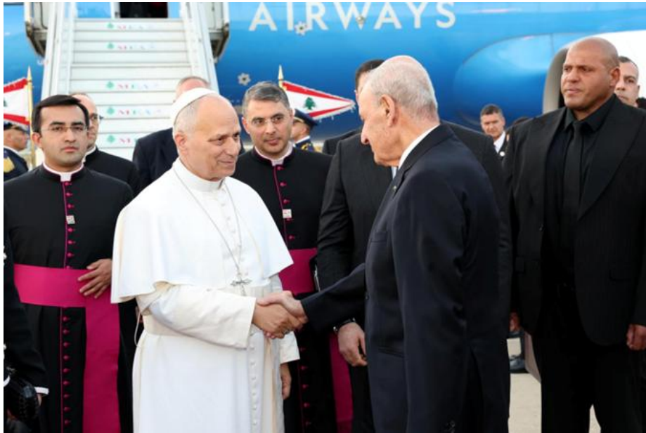
Nabih Berri reçoit le pape Leon XIV lors de sa visite à Beyrouth le 30 novembre 2025.

François, il publiait cet hommage : « Nous perdons un homme : prêtre, moine, ascète, dévoué à l'adoration ; un homme qui a renoncé aux titres pour élever le message céleste à une dimension christique, affirmant qu'il ne saurait y avoir d'équivalence entre l'amour de Dieu et la haine de l'homme. [...] Il était tout cela — et plus encore : Sa Sainteté, le Souverain Pontife, le pape François — qui s'en va, les yeux, le cœur et tous les sens tournés vers la Palestine, vers le Liban, et vers tous les opprimés de la terre » 16 .