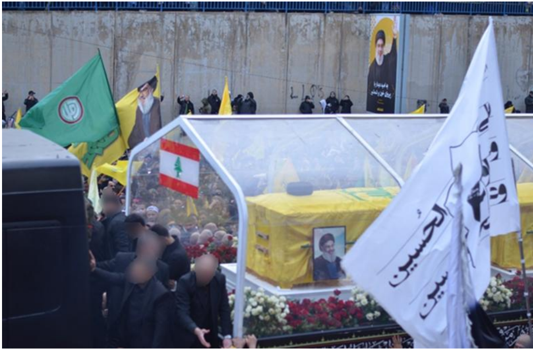
Un drapeau du mouvement Amal devant le cortège funèbre abritant les corps de Nasrallah et Safi al-Din, 23 février 2025

les relations entre les deux pays. La première session s'est déroulée à Washington le 14 avril 2026 entre l'ambassadrice du Liban aux États-Unis, Nada Moawad, l'ambassadeur d'Israël Yechiel Leichter et l'ambassadeur américain en Israël Mick Huckabee. L'absence du Hezbollah, pourtant principal belligérant et objet des négociations, et la poursuite des opérations militaires israéliennes, certes sur un rythme moins intense et concentrées dans le Liban Sud, soulignent la fragilité du processus.